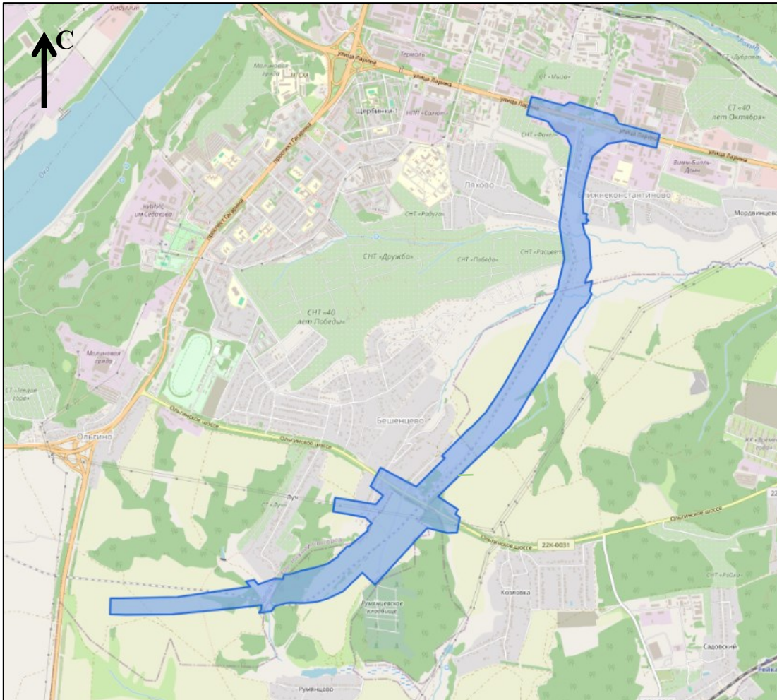
Схема границ подготовки документации по планировке территории (арх. № 118/24)